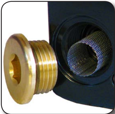
Crépine de protection