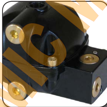
3 raccords d'entrée