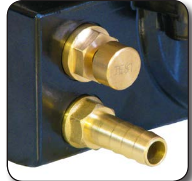
Bouton de test